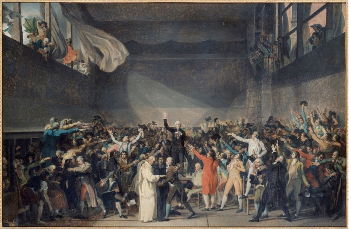
Le Serment du Jeu de Paume, David