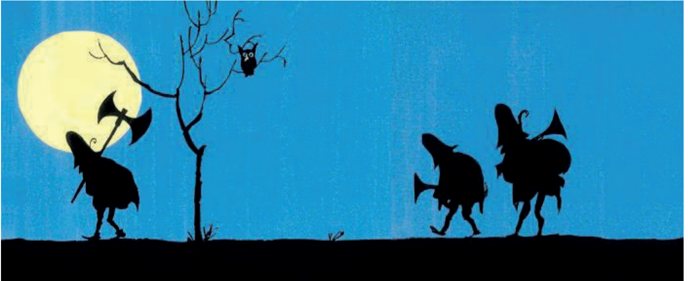
Les Trois Brigands (titre original : The Three Robbers ) album illustré de Tomi Ungerer paru en 1961.

Tomi Ungerer obtient le Prix Hans Christian Andersen en 1998, la plus haute distinction pour un auteur de livres pour enfants.